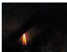
アキレスセイデンF