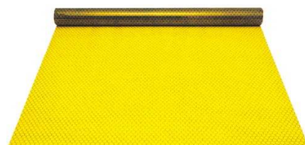
ブラックセイデンF